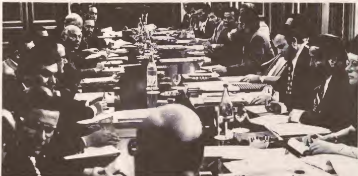
Momento historico na Hulanda durante September di e aña aki na cual ocasion e delegacion Arubano ta reuni cu representantenan di Gobierno Hulandes pa delibera tocante un independencia aparte pa Aruba. Tur sectornan cu tabata representa den e delegacion Arubano, partidonan politico, sindicacionan y comercio ta pro independencia pa Aruba.